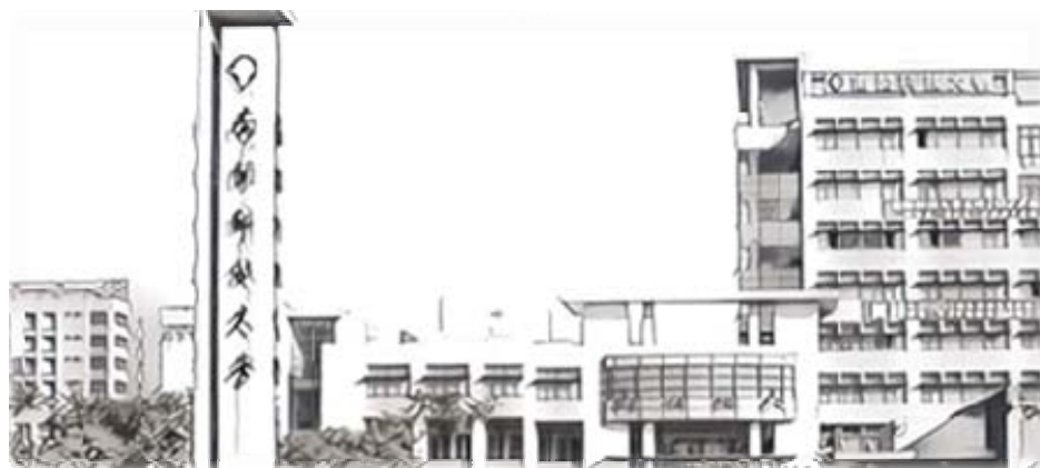
NAN KAI UNIVERSITY OF TECHNOLOGY